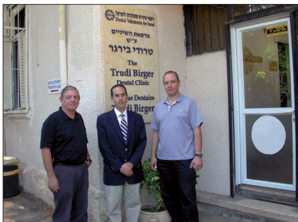
Fig. 1. Dr. Boj durante su estancia en DVI.

dad de Barcelona, disfrutaron de esta gran experiencia a nivel humano, cultural y formativo en DVI (Figs. 3 y 4).