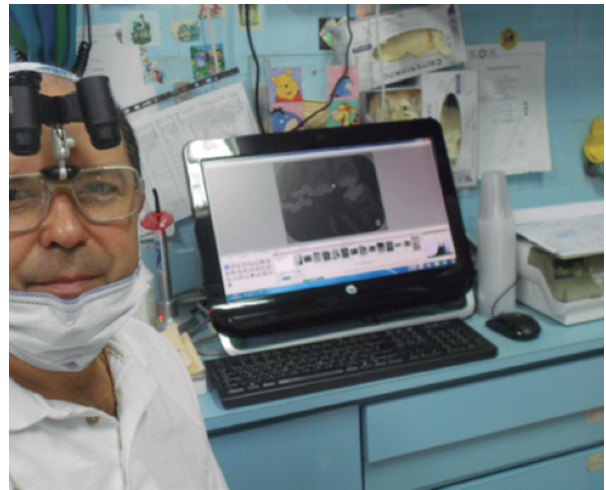
Fig. 3. The clinic has the necessary technology.

careful dental treatment, on disease prevention and on accepting diversity (3).