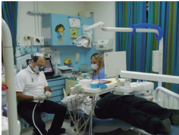
Fig. 2. There are volunteers from all over the world.