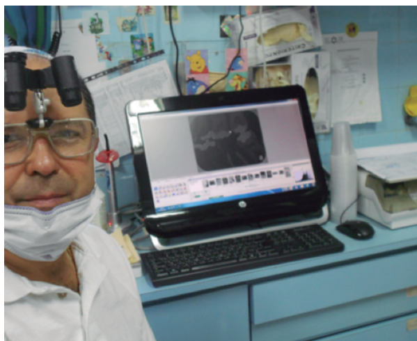
Fig. 3. La clínica ofrece la tecnología necesaria.

abiertas en otras ciudades de todo el mundo. DVI es un ejemplo de convivencia. Sus servicios se centran en tratamientos dentales cuidadosos, en la prevención de la enfermedad y en la aceptación de la diversidad (3).