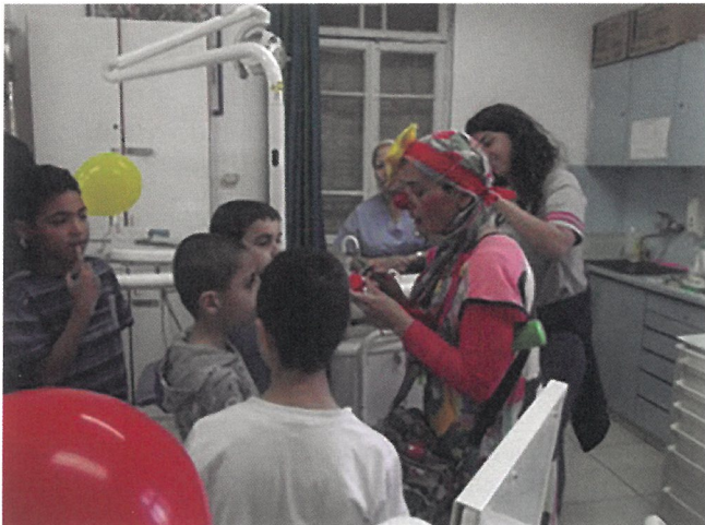
Fig. 1. El payaso ayuda con explicaciones sobre las visitas.

Los residentes de odontopediatría que realizan una rotación en la clínica DVI tienen el privilegio de recibir orientación e instrucción de doctores expertos en el área con años de experiencia académica; aprenden métodos avanzados de las mejores prácticas internacionales para el tratamiento dental en niños, trabajan con los mejores equipos y materiales disponibles y aprenden a tratar a los niños con técnicas de manejo del comportamiento sin el uso de sedación o anestesia general (2,3).