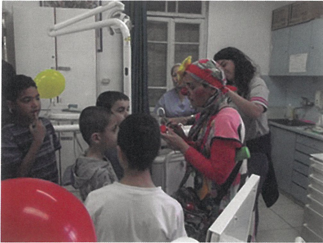
Fig. 1. The clown helps with explanations regarding visits.