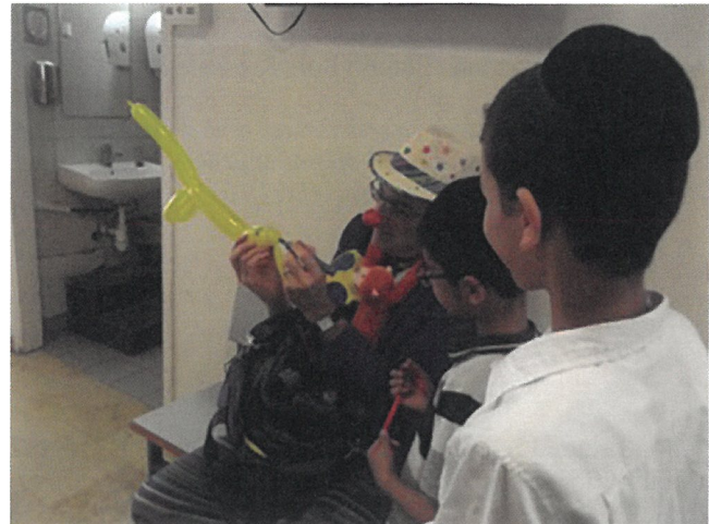
Fig. 2. El payaso distrayendo a los niños.