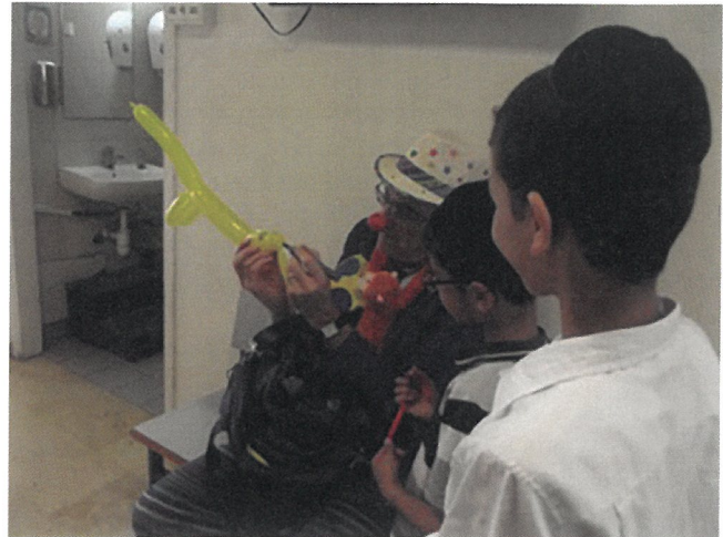
Fig. 2. The clown distracting the children.

and individuals from different shelters, the clinic also treats children who have been removed from their family homes by court order (1). These children who have suffered different types of abuse and who then struggle with problems of separation and neglect are understandably sensitive and fearful. They get nervous easily, which makes dental treatment all the more challenging (1). Having a clown working with these patients in the waiting room and if necessary in the treatment room too, significantly reduces their anxiety and it has allowed our volunteer dentists and pediatric residents to offer high quality treatment even to the most apparently difficult patients (1).